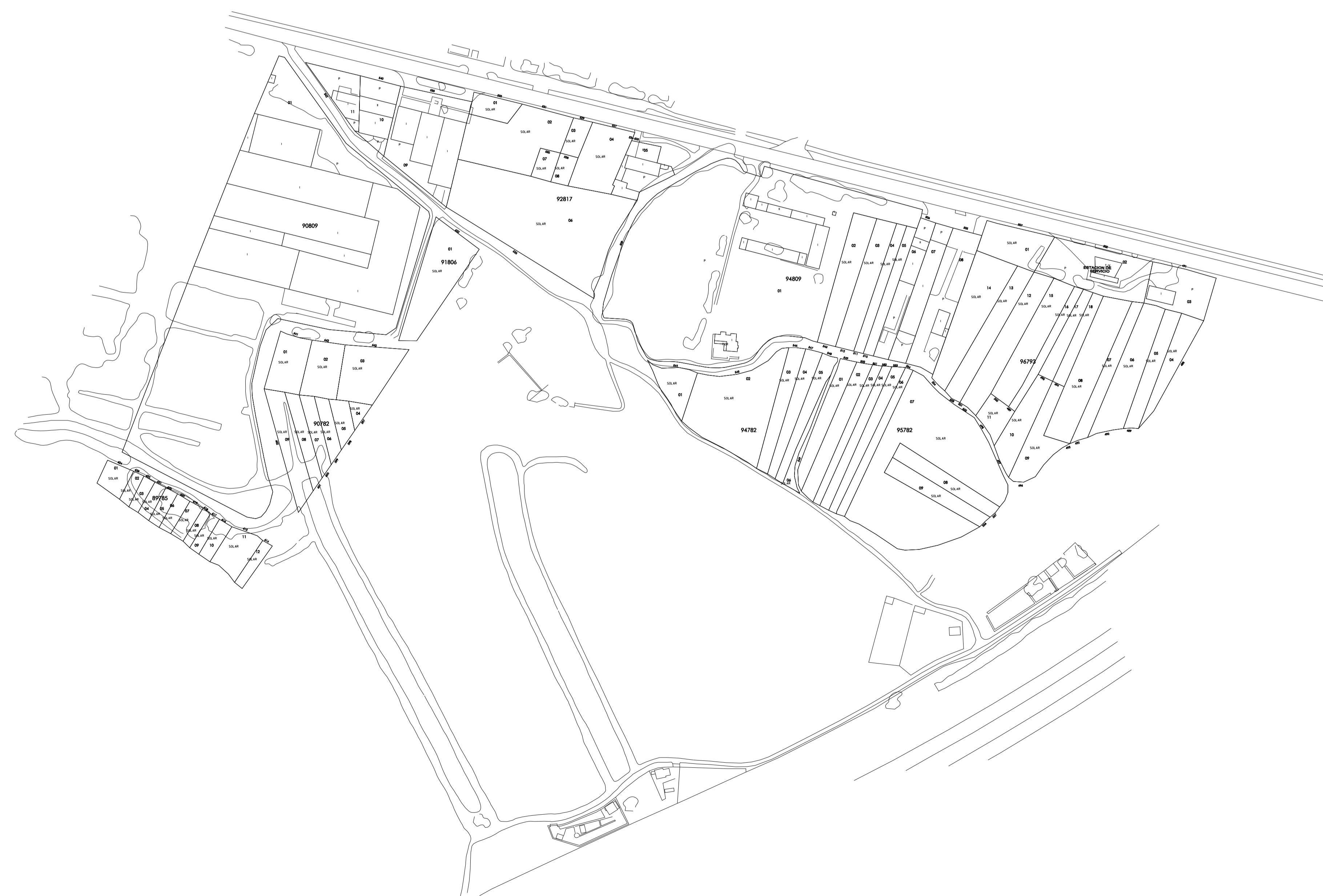
Subi "A" / Subi "B"