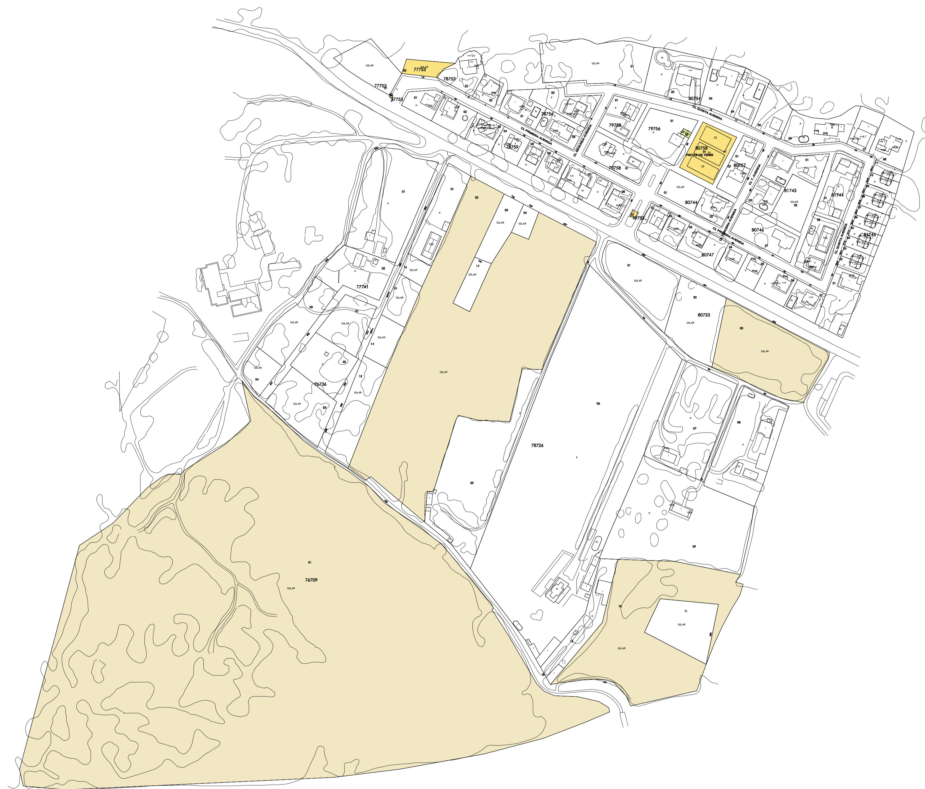
URBANIZACION FUENTES BLANCAS / Sub.1 / Sub.2 / Sub.3